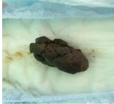
อุจจาระเป็นก้อนแข็ง