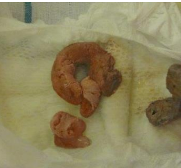
อุจจาระเป็นก้อนนิ่ม